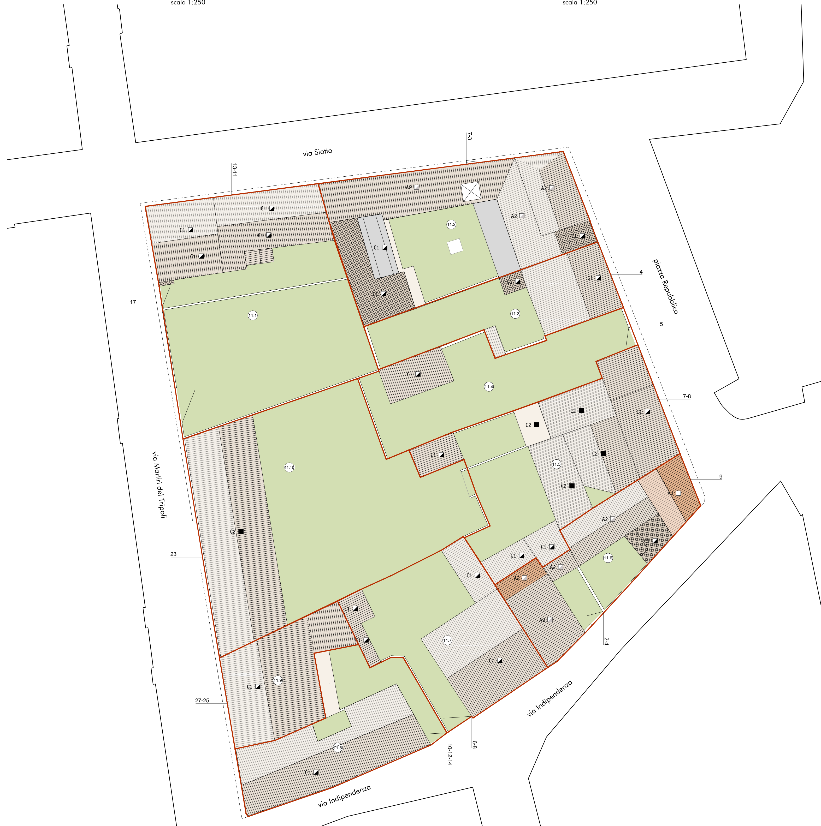
stato di progetto - planimetria dell'isolato scala 1:250