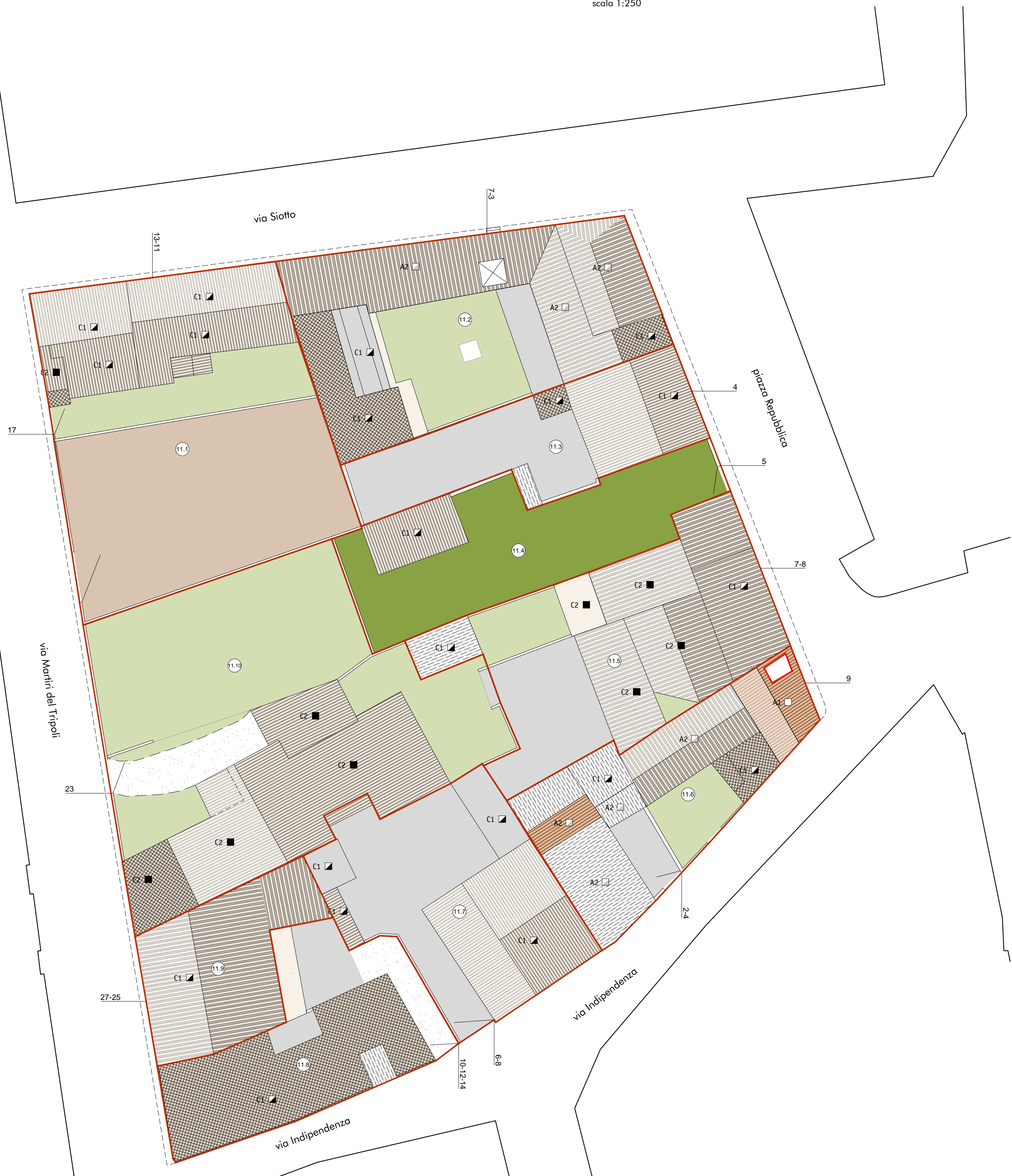
stato di fatto - planimetria dell'isolato scala 1:250