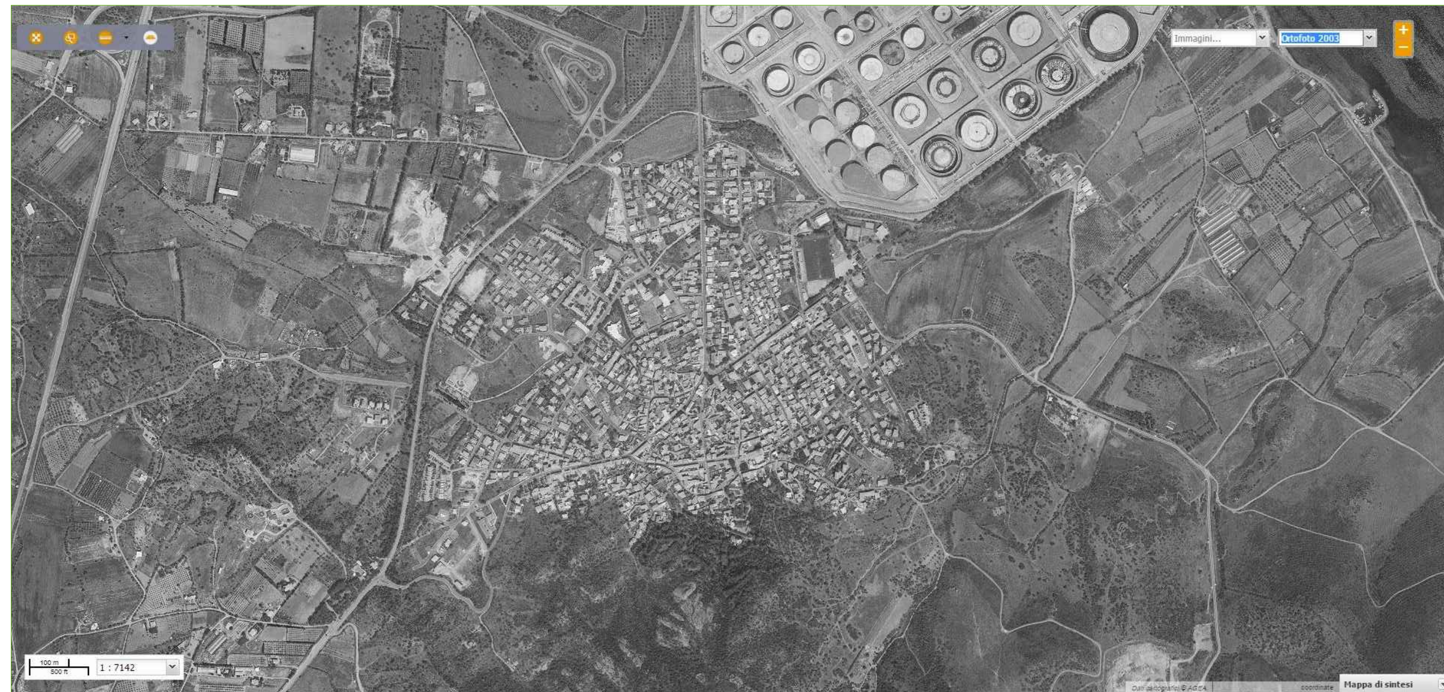
ortofoto storica 2003