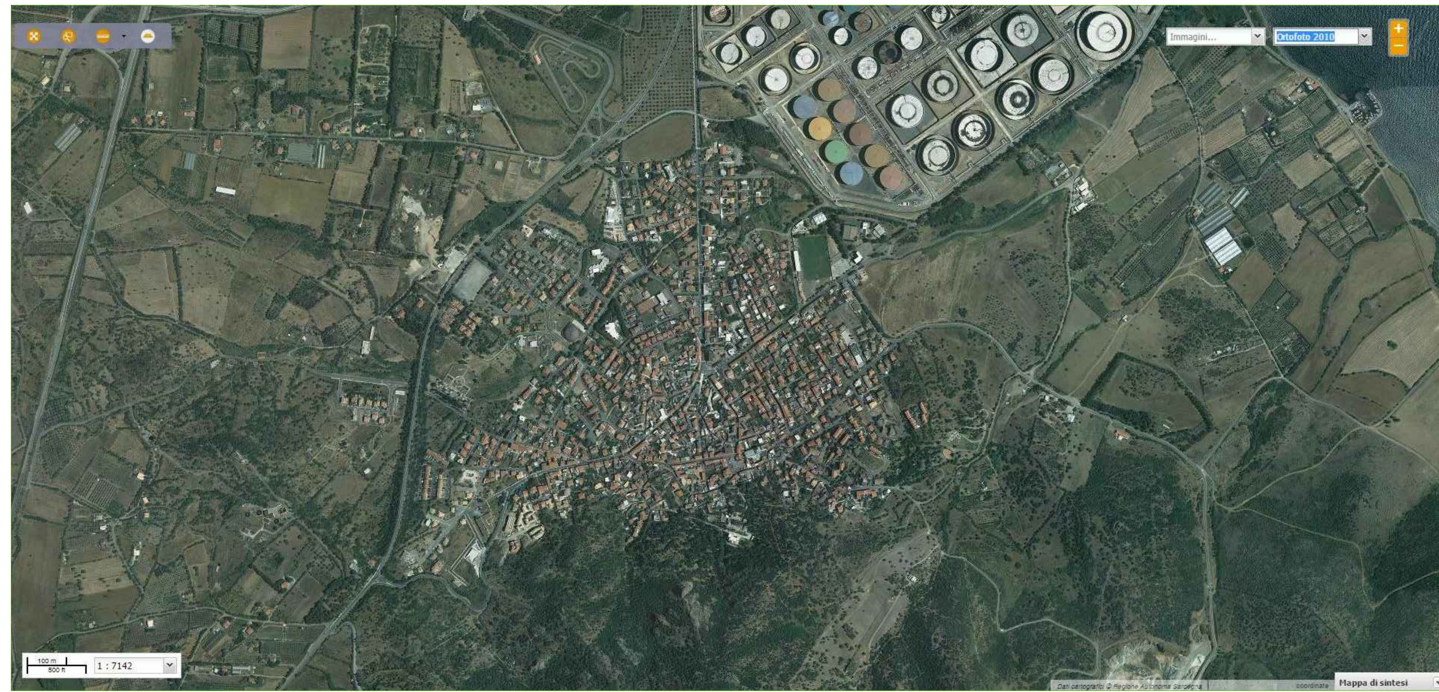
ortofoto storica 2010