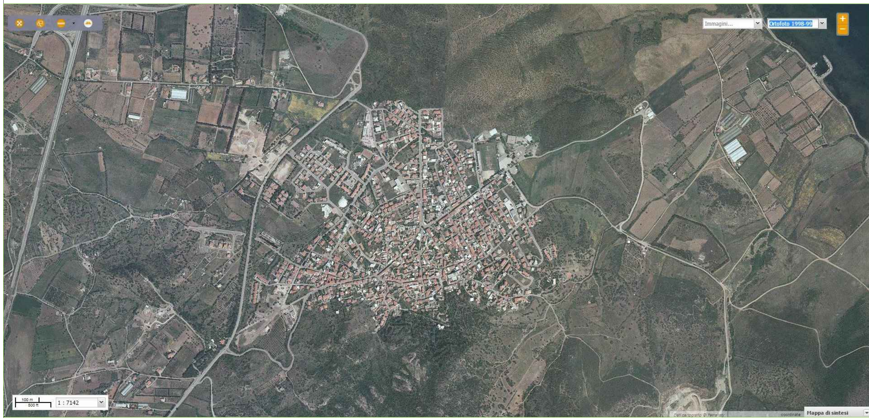
ortofoto storica 1998-1999