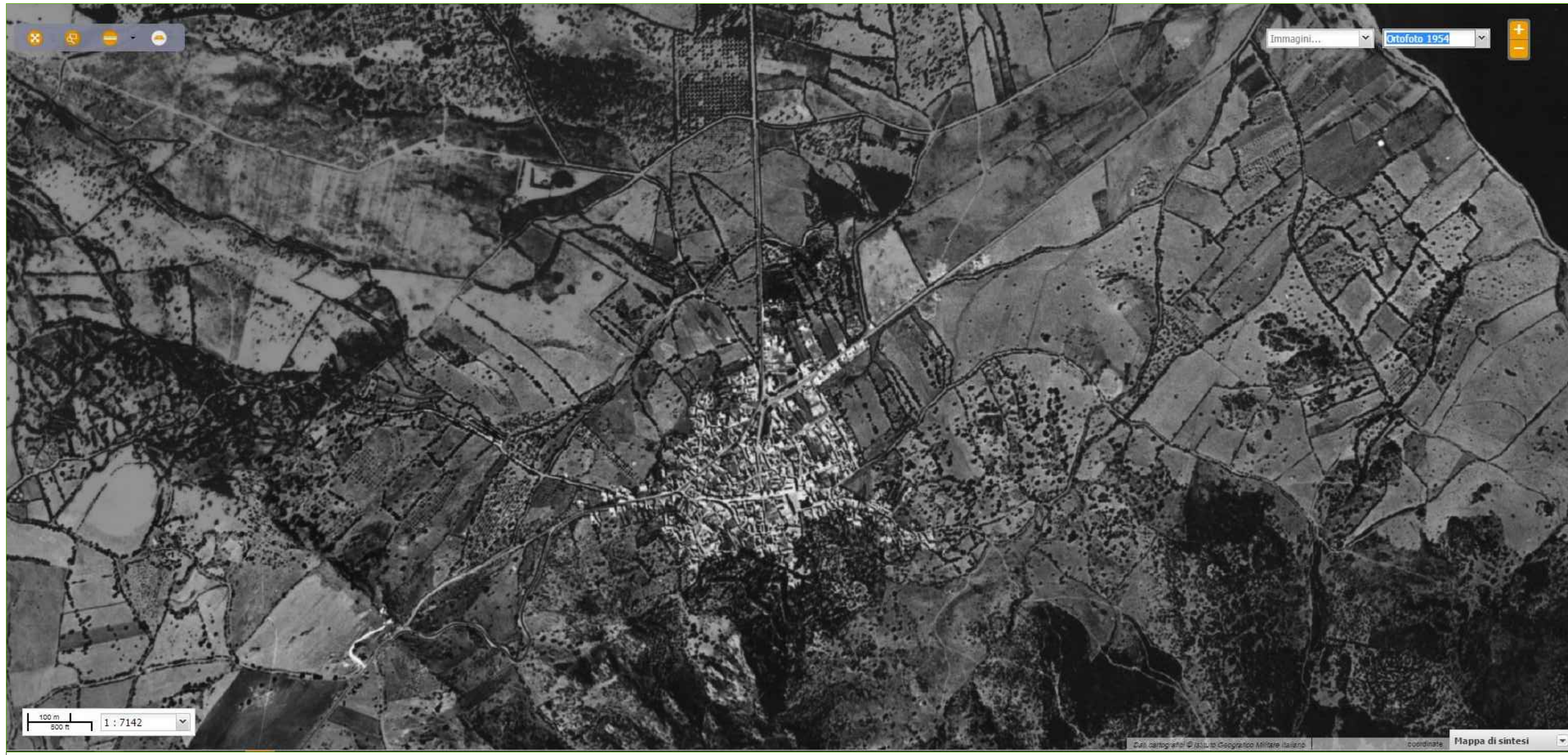
ortofoto storica 1954