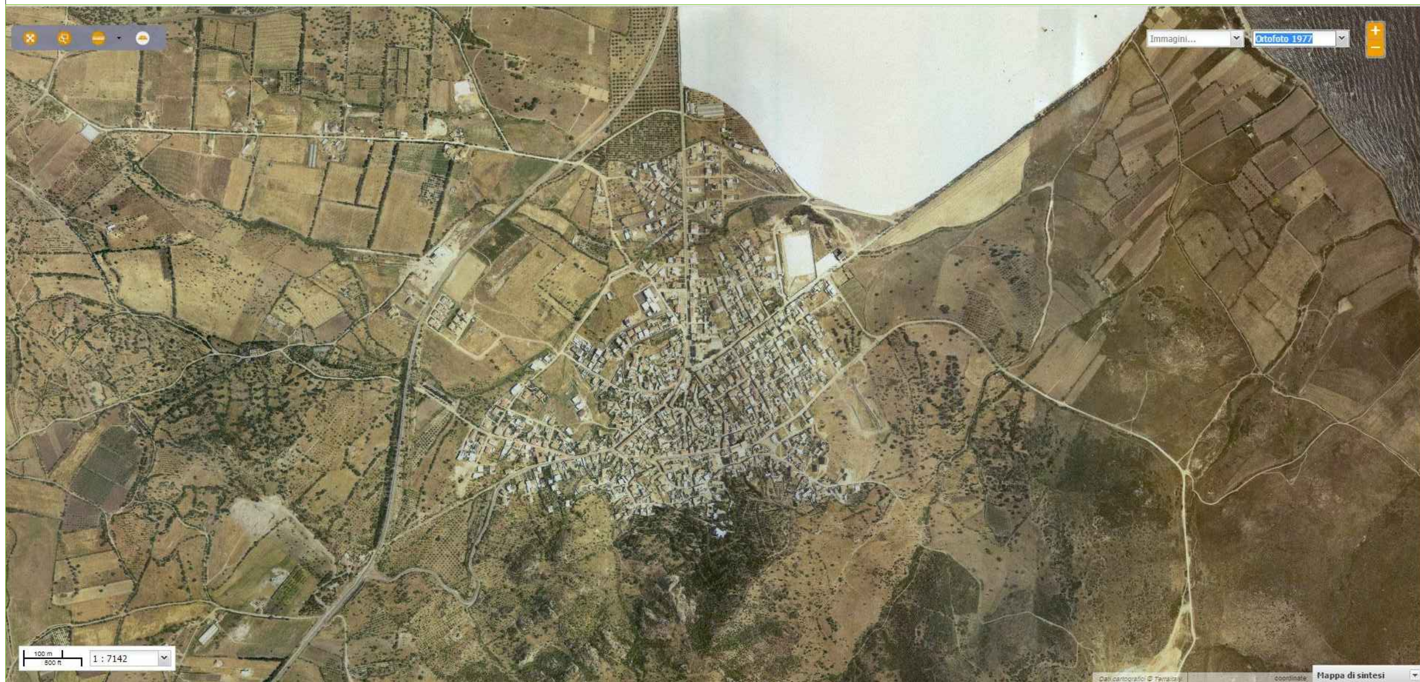
ortofoto storica 1977