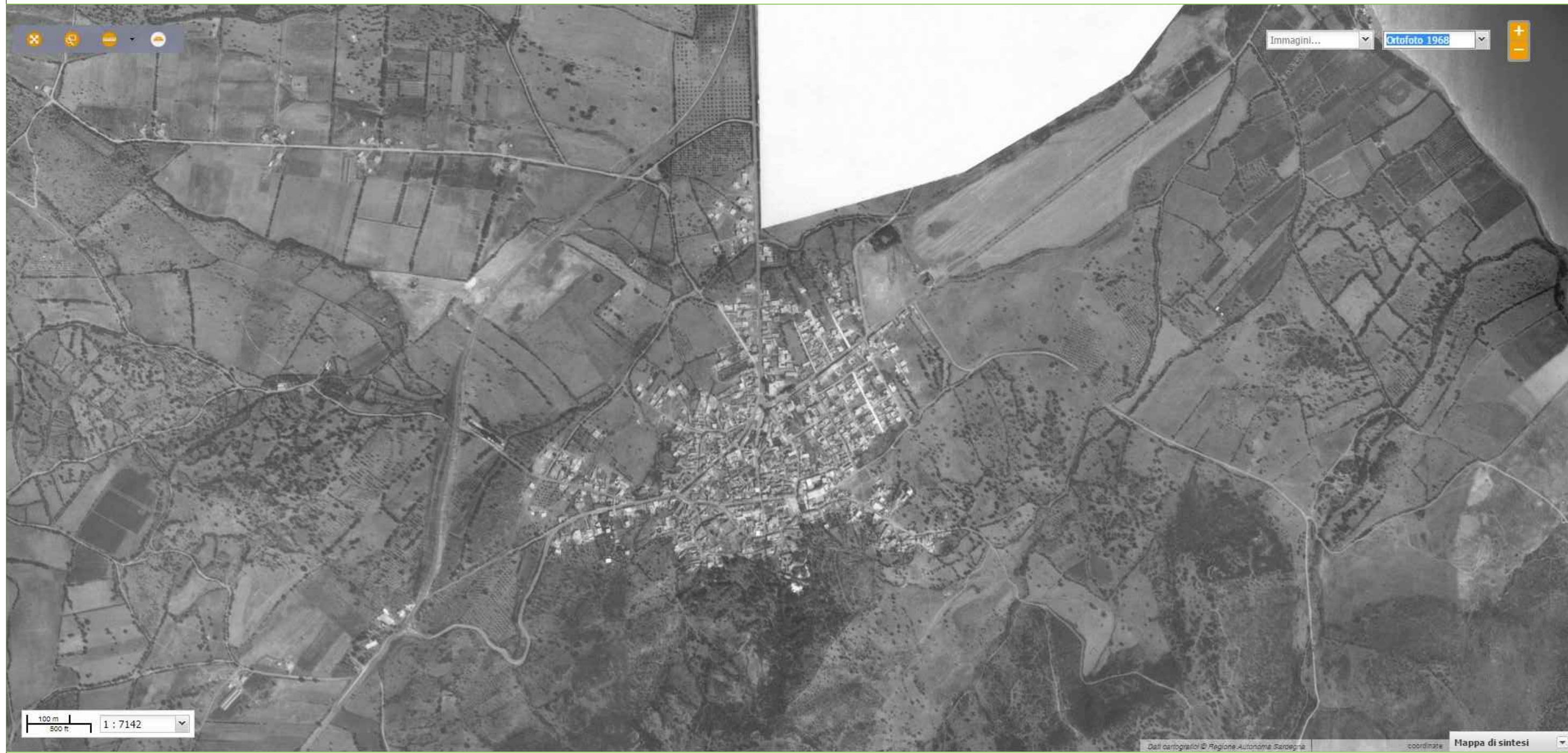
ortofoto storica 1968